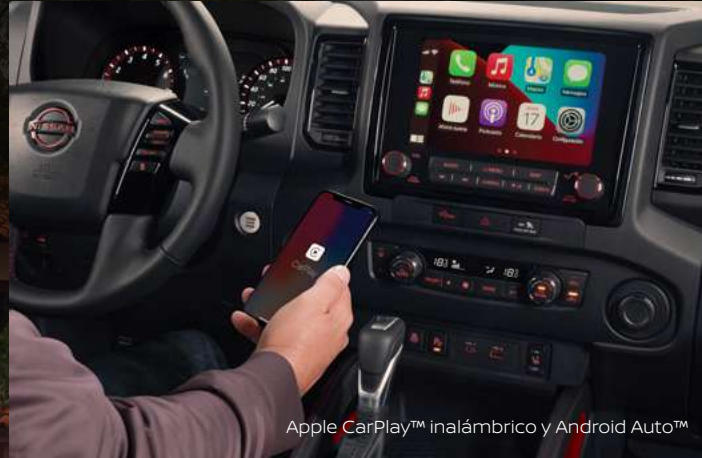
Apple CarPlay™ inalámbrico y Android Auto™