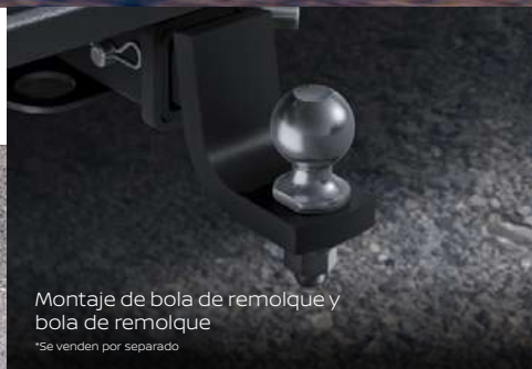
Montaje de bola de remolque y bola de remolque *Se venden por separado