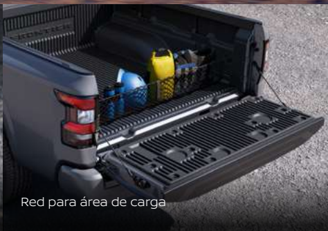
Red para área de carga