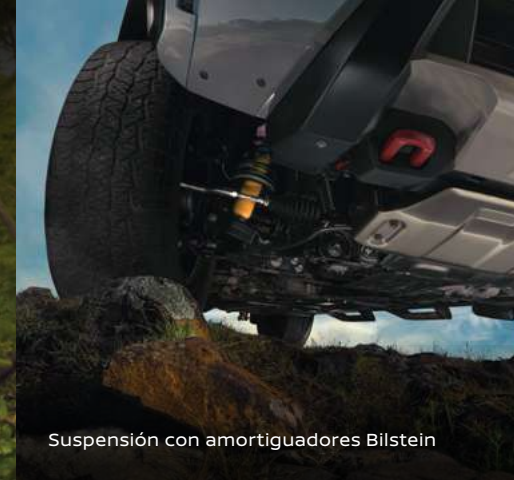
Suspensión con amortiguadores Bilstein