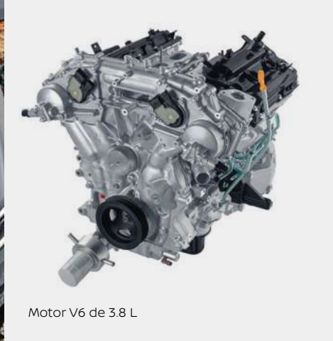
Motor V6 de 3.8 L