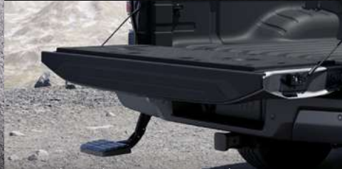
Escalón retráctil para acceso al área de carga