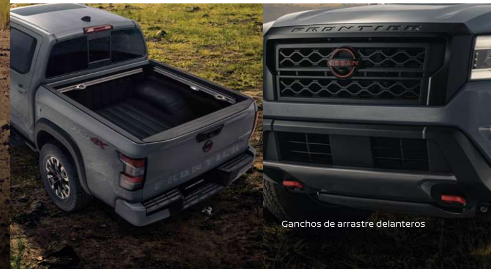
Ganchos de arrastre delanteros