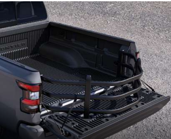
Extensor de área de carga

Personaliza tu nueva Nissan Frontier V6 PRO-4X con los accesorios Nissan.