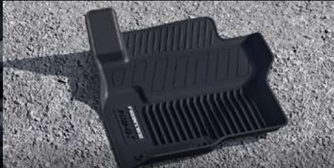
Tapetes de uso rudo