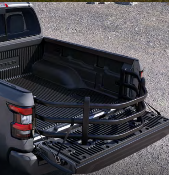
Extensor de área de carga