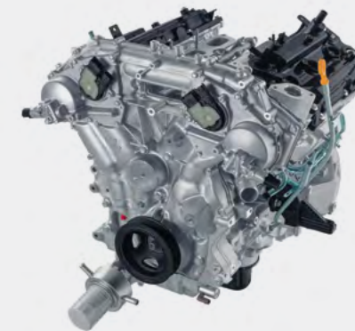
Motor V6 de 3.8 L