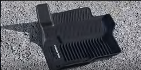
Tapetes de uso rudo