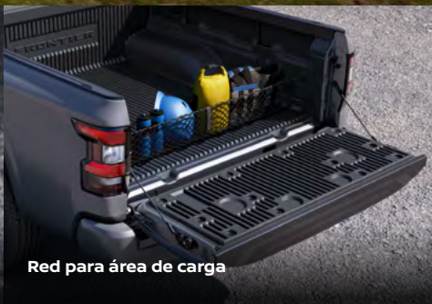
Red para área de carga