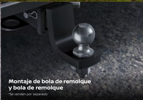
Montaje de bola de remolque y bola de remolque