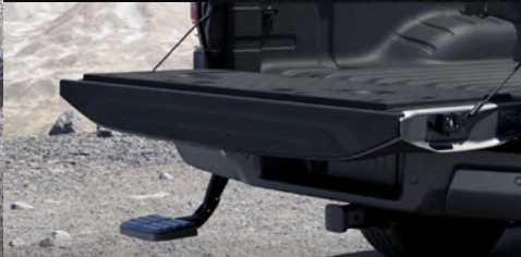
Escalón retráctil para acceso al área de carga